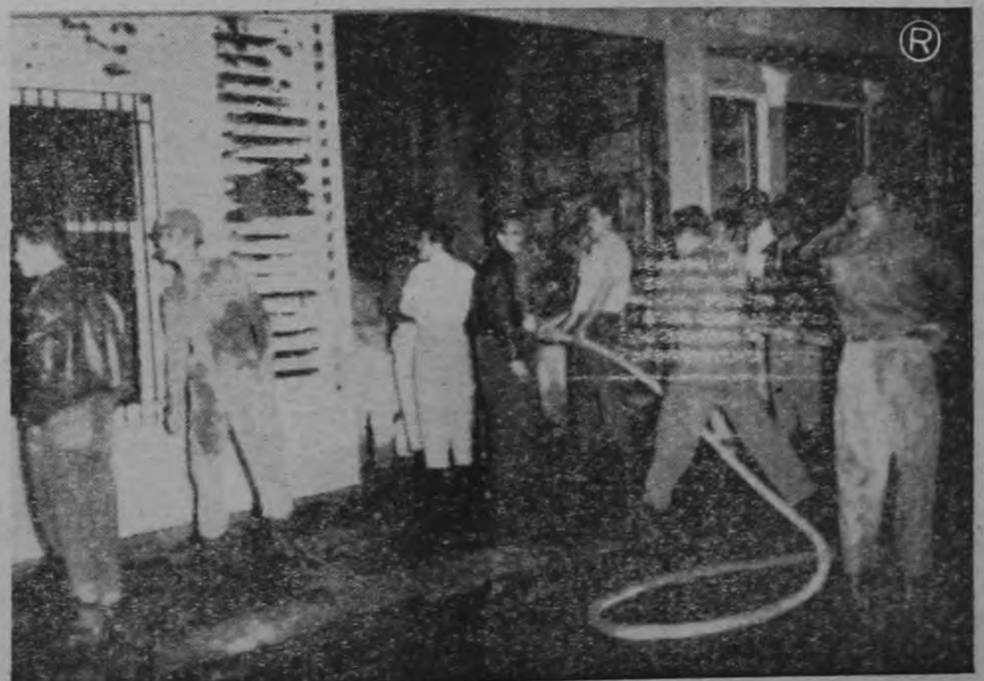
ULTIMOS ESFUERZOS.— Voluntarios del Cuerpo de Bomberos se introducen con mangueras al interior del destruido edificio a fin de dominar totalmente al fuego.