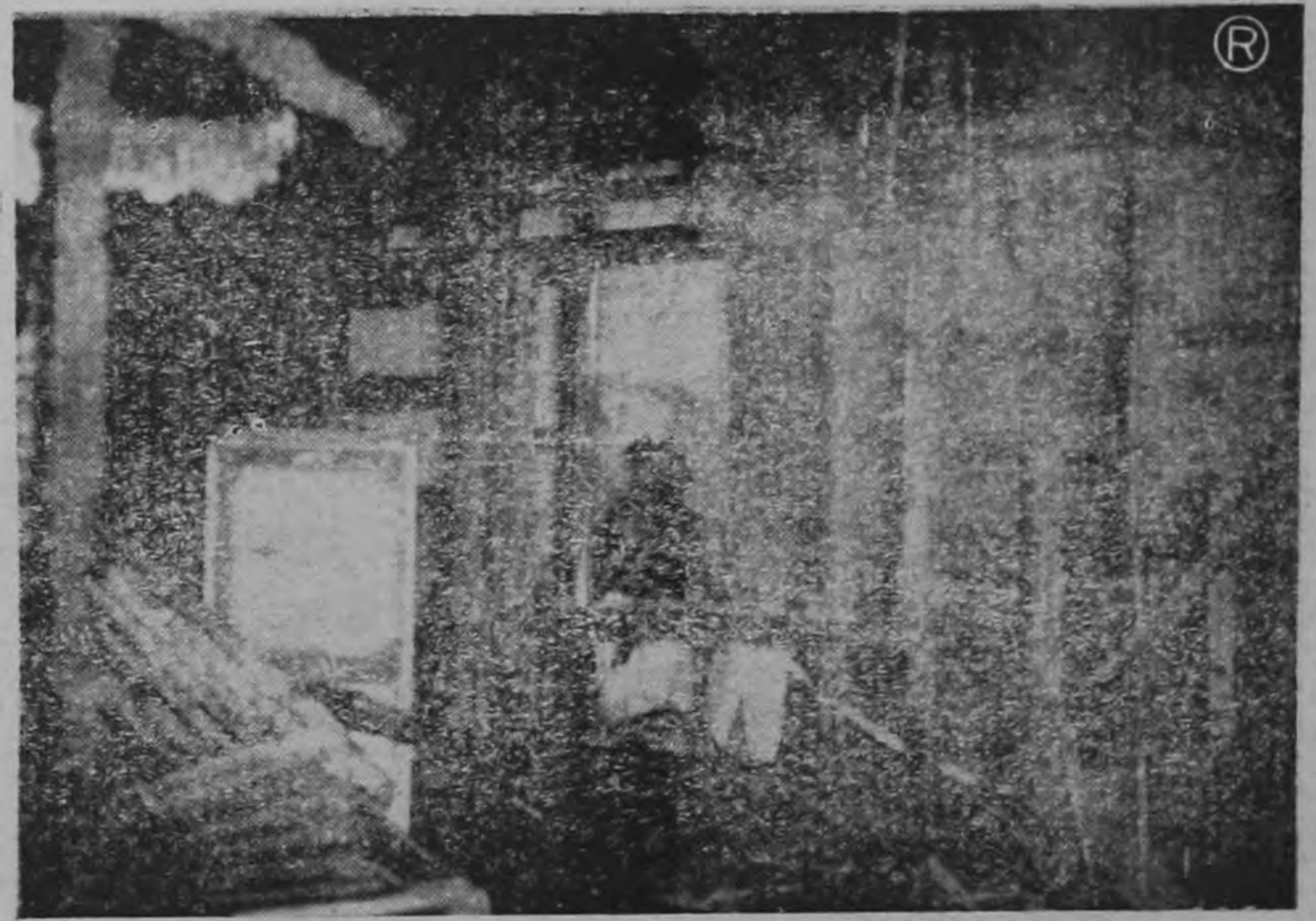
DESTRUCCION.— Así quedaron las oficinas adyacentes al Taller Miller del señor Girón. Carbón y cenizas donde anteriormente había muebles y objetos muy valiosos.