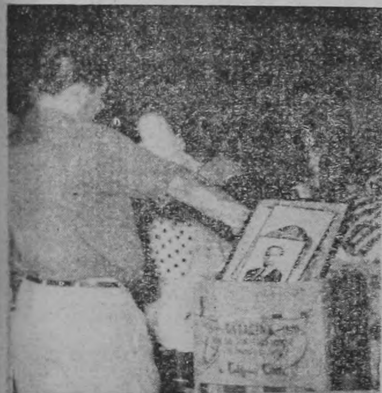
SALVANDO PERTENENCIAS.—Esta gráfica muestra el momento en que los vecinos del lugar del siniestro sacan de sus casas los objetos de valor para evitar perderlos.

En esa forma se logró salvar todos los papeles personales y los archivos de Lic. Echandi que estuvieron a punto de ser destruidos por las llamaradas.